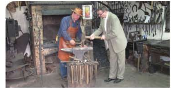
Szlak żelaza i kowalskich tradycji w Wojciechowie