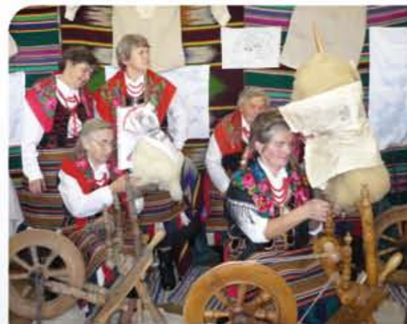
Impreza kulturalna „Dziedzictwo Ojców” w Żyrzynie