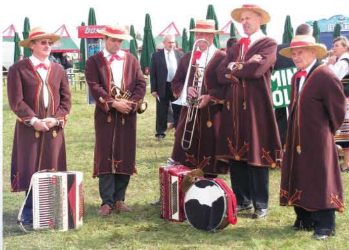
Kapela Wojciechowska z Wojciechowa, jej historia zaczyna się w 1926 r.