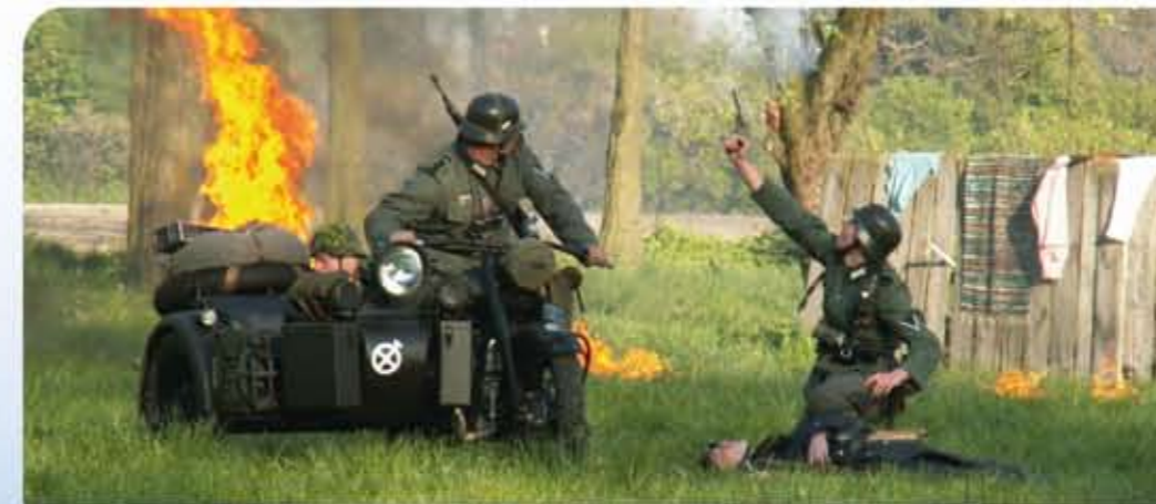
Grupa Rekonstrukcji Historycznych „Wilki” z Osin (gm. Żyrzyn) – Mistrzowie teatru „żywej” historii w plenerze