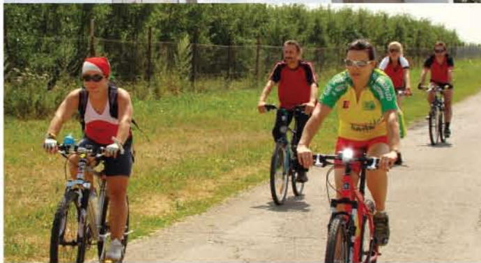
Szlak rowerowy „W Krainie Jana Pocka” w Markuszowie