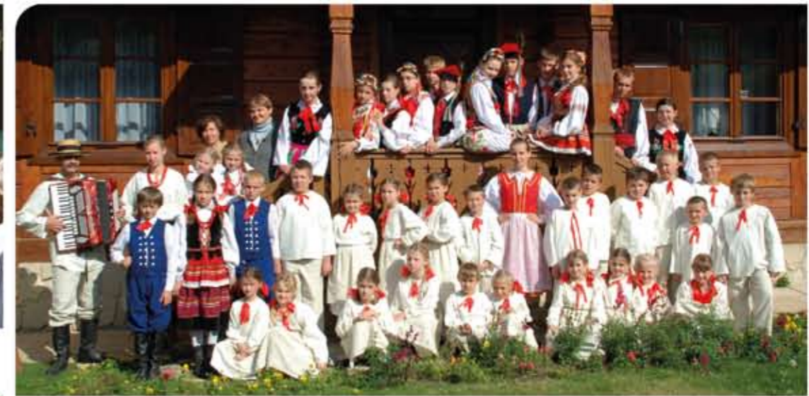
Zespół Tańca Ludowego „Bystrzacy” z Wąwolnicy