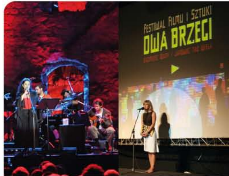
Festiwal Filmowy „Dwa Brzegi” w Kazimierzu Dolnym