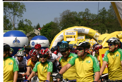
Fot. Pałac Małachowskich w Parku Zdrojowym, poniżej drużyna Bankowego Towarzystwa Rowerowego z Nałęczowa na starcie zawodów Skandia w kolarstwie górskim w Nałęczowie.